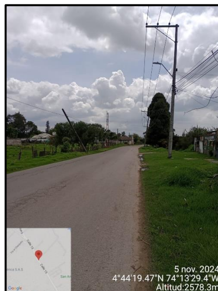
Ilustración 2. Evidencia recorrido, punto 5.