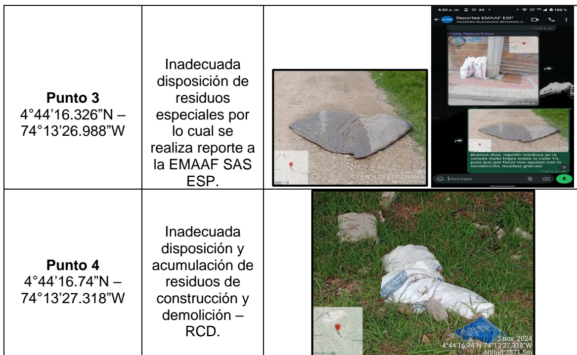
Tabla 1. Hallazgos recorrido de control y vigilancia vereda Siete Trojes.

Adicional a ello, en los puntos 1, 5 y 6 no se evidenciaron anomalías que afecten el componente ambiental propio del recorrido de control y vigilancia en la vereda Siete Trojes, como se observa en las siguientes ilustraciones: