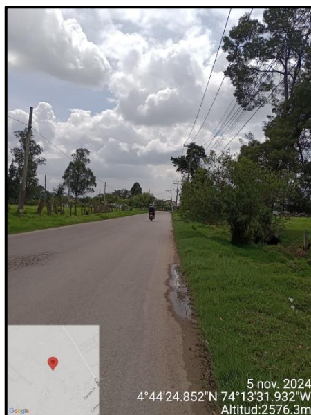
Ilustración 2. Evidencia recorrido, punto 6.

C.P.250020 Tel. +57(1) 823 40 70 823 40 71 / 823 40 73 Fax. + 57(1) 825 76 20 Dir. Cra. 14 No. 13-05