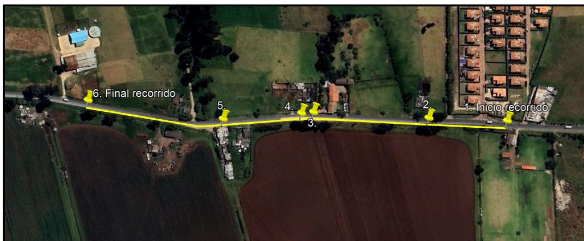
Ilustración 1. Recorrido de control y vigilancia en la vereda Siete Trojes.

Con base en lo anterior, el día 05 de noviembre de 2024 se realizó recorrido de control y vigilancia en la vereda Siete Trojes desde las coordenadas 4°44'9.03"N – 74°13'22.674"O hasta las coordenadas 4°44'24.852"N – 74°13'31.932"O (ver ilustración 1. Ruta amarilla)