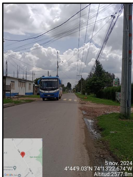
Ilustración 2. Evidencia recorrido, punto 1.

Adicional a ello, en los puntos 1, 5 y 6 no se evidenciaron anomalías que afecten el componente ambiental propio del recorrido de control y vigilancia en la vereda Siete Trojes, como se observa en las siguientes ilustraciones: